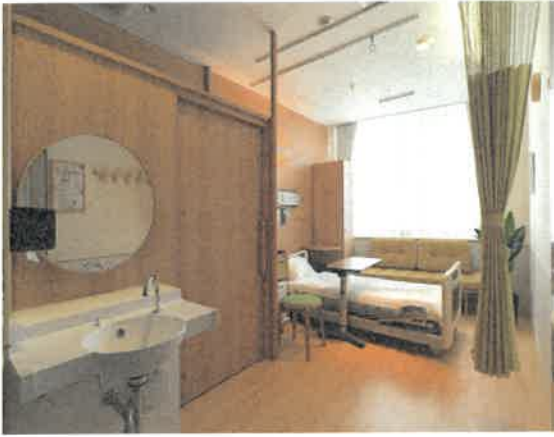
SB室増設工事イメージ図（別紙4）