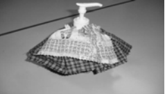
消毒ジェルカバー