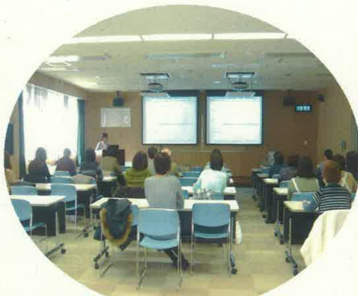
平成25年2月 ボランティア研修会の様子