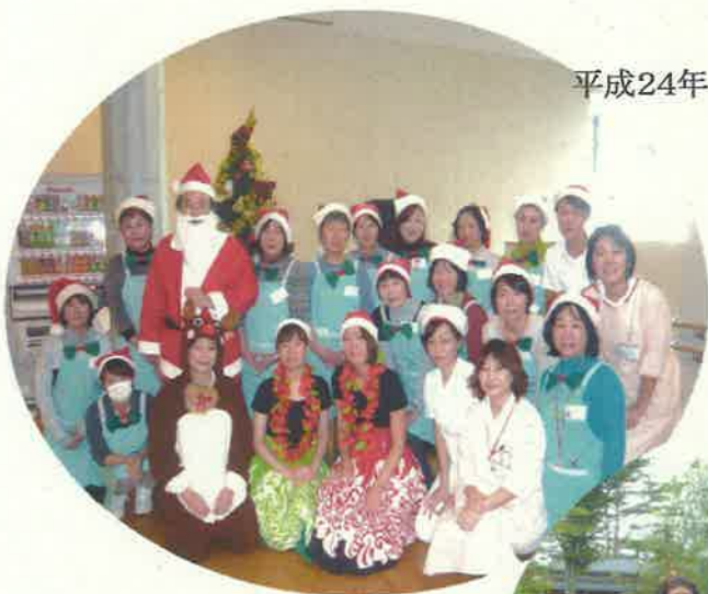
平成24年12月 緩和ケア病棟クリスマス会