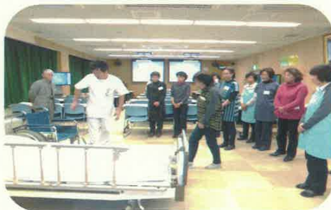
平成27年2月ボランティア研修会「安心・安全な移乗」講習の様子