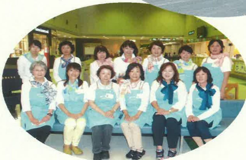
平成27年8月 100回記念ロビーコンサートに手話ソングで出演