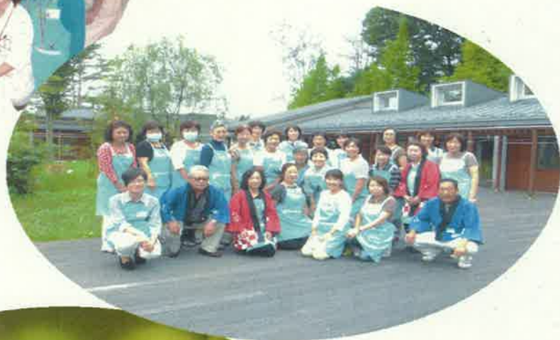
平成26年8月 緩和ケア夏祭り